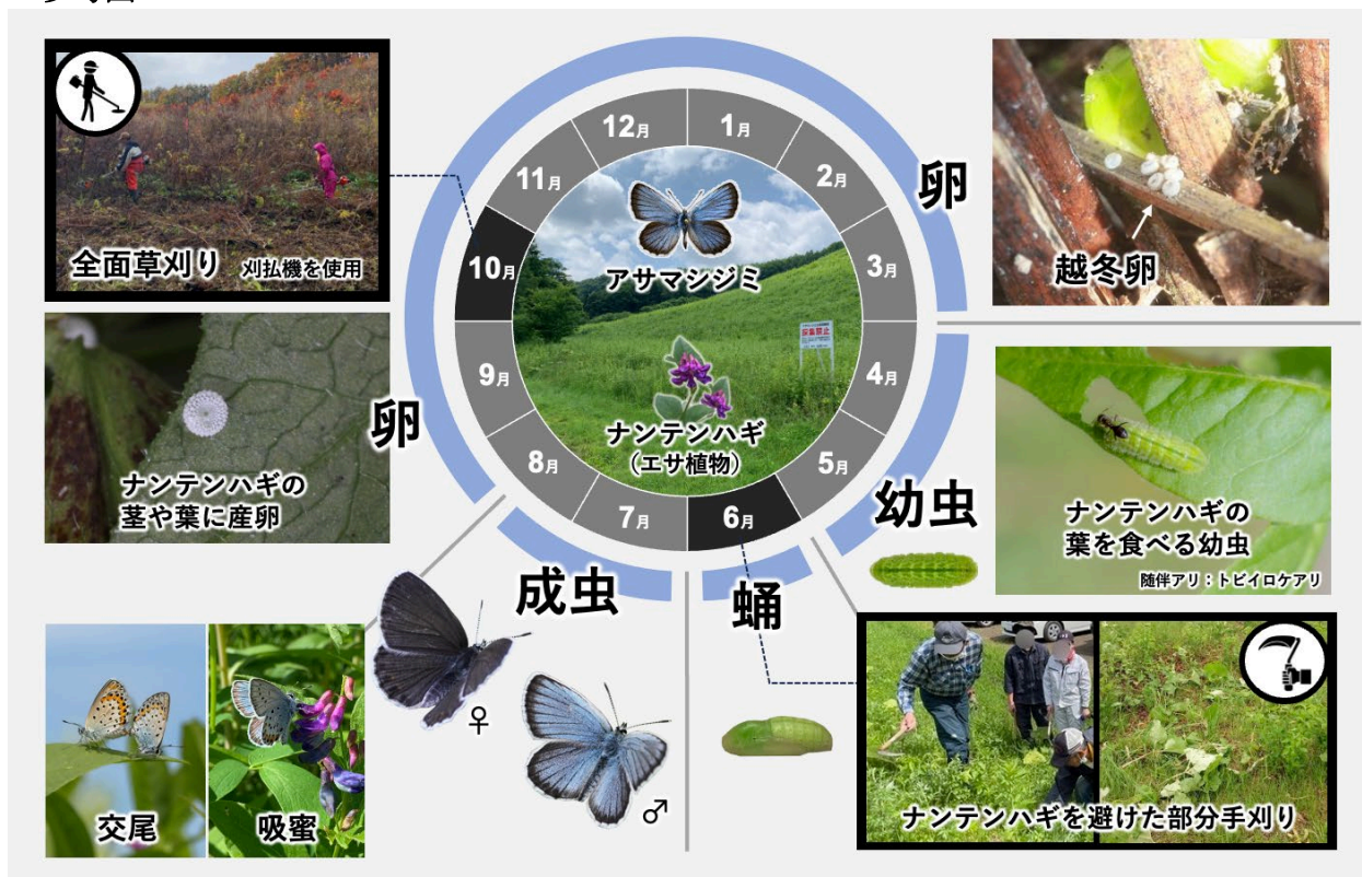
図1 研究概要 (アサマシジミ北海道亜種的生活サイクルを踏まえた草刈り時期と方法)